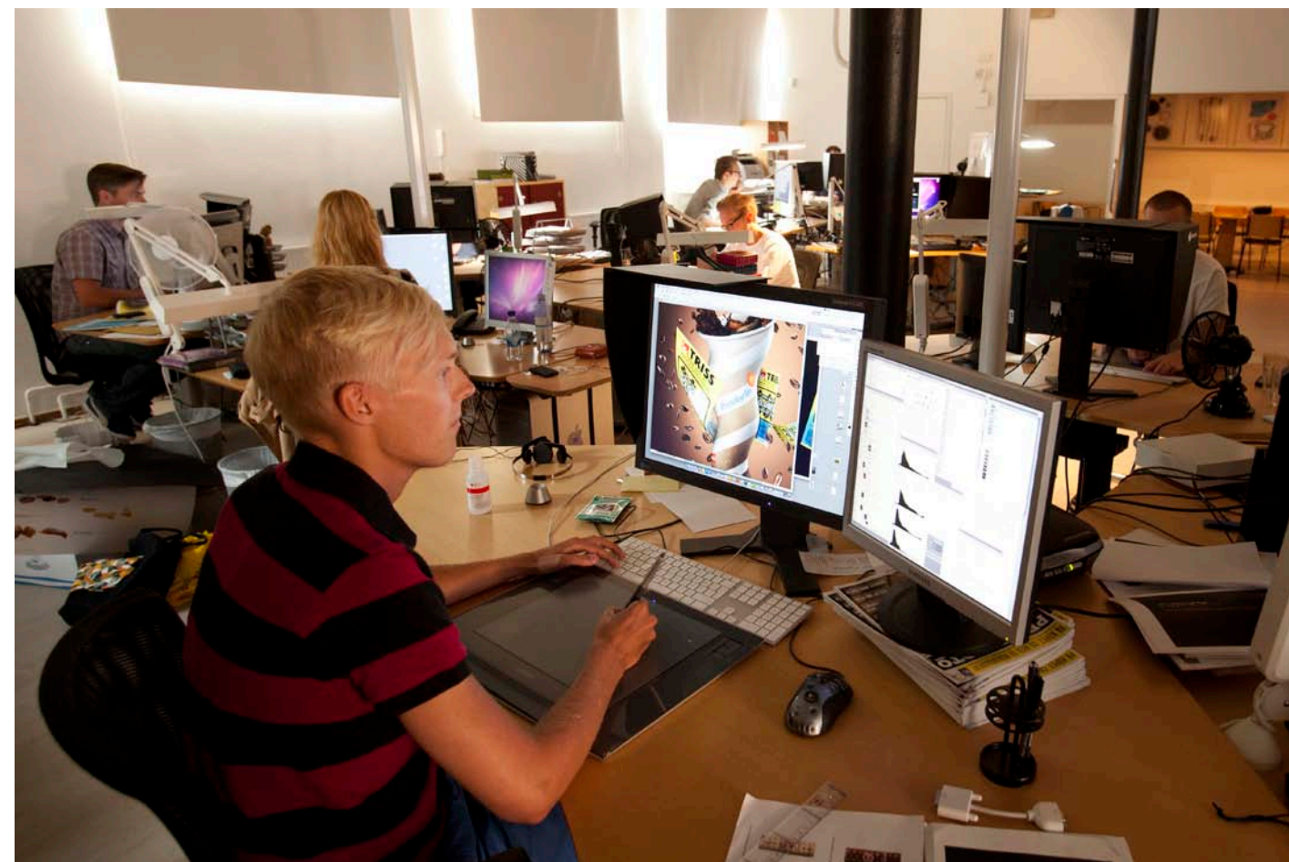
◆ Åtta personer jobbar med bildbehandling av de fem fotografiernas bilder. Snart kan de bli fler när Bsmart satsar på animering.

När en fotografering är klar gör fotografen ett preliminärt urval som kollas av mot byrå och slutkund. Därefter går jobbet vidare till den