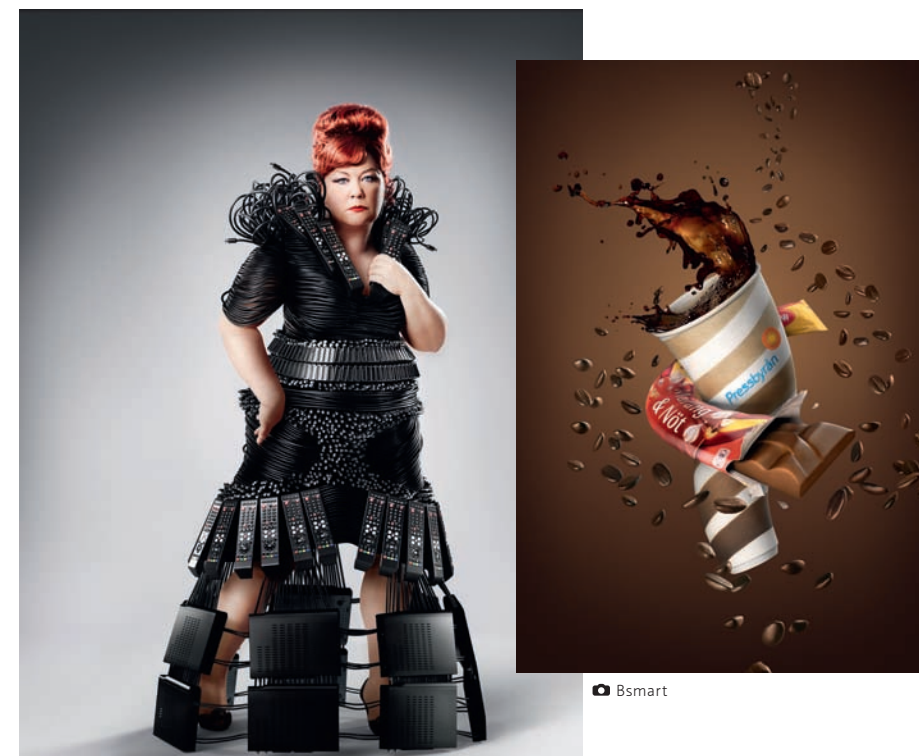
• Bilder till annonskampanjer för Comhem och Pressbyrå.

– Sådant kommer mer erfarenheten. Jag ser ganska snabbt när jag tittar på en bild vad jag behöver börja med för att få den dit jag vill, säger Erik.